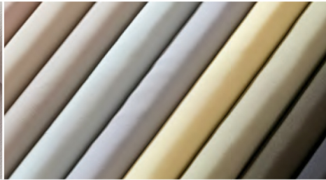
紋織 単衣用襦袢地(3柄) 別注染・お仕立て上り 79,800円+税