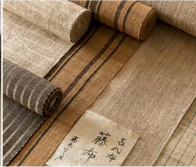
自然布 八寸帯 お仕立て上り 128,000円～+税