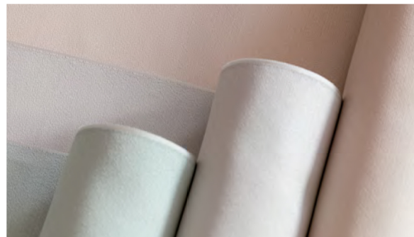
勝山さと子 作 単衣色無地

〒400-0306 山梨県南アルプス市小笠原379 ☎ フリーダイヤル 0120-509-529 お問い合わせ、ご予約はフリーダイヤルをご利用ください。 www.shiota-shouten.co.jp