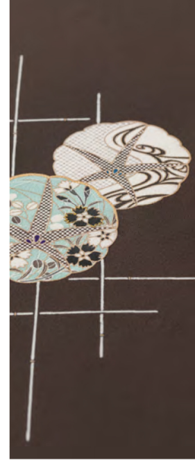
着物乃塩田選 単衣附下 朝顔『檜垣に朝顔』(左) 薄物附下 芒『静秋』(右)

美術工芸 啓「単衣・夏帯新作発表会」 令和3年5月 同会場「ギャラリー・フラスコ」にて開催予定