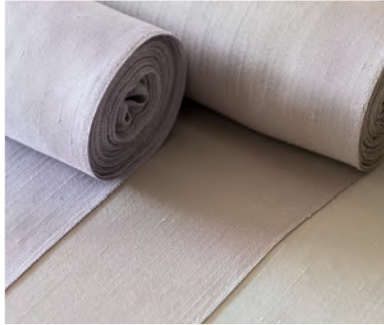
夏結城 お仕立て上り 168,000円+税